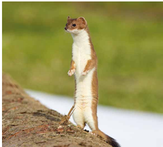
Hermine aux aguets sur un tronc