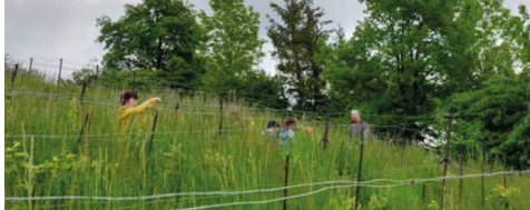
Un vignoble à l'enherbement favorable à la biodiversité

Depuis plusieurs années notre association s'engage aux côtés d'autres sections romandes de Pro Natura dans un projet novateur visant à augmenter la biodiversité dans les vignes. Les vignobles de notre belle région ont une longue histoire de production de vins de qualité, mais ils font face à des défis environnementaux croissants. Un équilibre entre la viticulture et la conservation de la nature est à trouver.