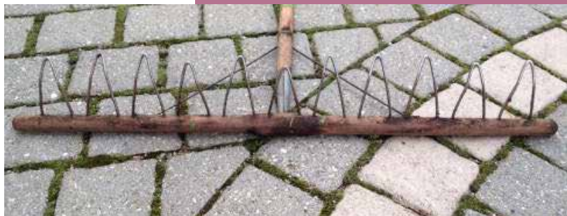
Râteau à boucles

Dans l'entretien de nos réserves naturelles, nous utilisons régulièrement des râteaux à boucles, qui sont très utiles dans certains milieux et plus efficaces que les râteaux conventionnels car ils ne crochent pas au sol. Il est malheureusement impossible de trouver ce type d'outils dans le commerce, et nous sommes donc à la recherche d'un-e artisan-e ou bricoleur-euse pouvant nous en fabriquer une série. Si vous êtes cette perle rare, où si vous pensez la connaître, n'hésitez pas à contacter le secrétariat cantonal.