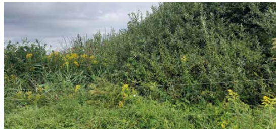
Solidage géant, parc à chevaux en marge de la réserve des Mosses de la Rogivue