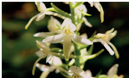
Platanthère à deux feuilles

Balade botanique, géologique, dendrologique et ornithologique , avec les naturalistes Sylvain Meier, Georges Mermillod et Olivier Jean-Petit-Matile. Max. 15 personnes, inscription obligatoire à sylvain.meier@bluewin.ch . Rdv gare de Gland côté Jura. Train de Lausanne 8h23, changer à Nyon 8h55. Nous irons à la découverte des richesses naturelles le long du sentier des Toblerones et dans la réserve (prairie sèche) de la Villa de Prangins. Pique-nique. Retour vers 16h, trains fréquents.