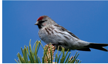
Sizerin cabaret

Faune, avifaune et flore de la réserve d'Aï-Famelon , avec le responsable de réserve Jacques Erard, jacqueserard8@gmail.com. Inscription obligatoire. Rdv gare de Leysin-Feydey. Train de Lausanne 7h14, changer à Aigle 7h52, arr. 8h19. Sentier de montagne, dénivelé 1000 m, pique-nique. Retour 17h14 au plus tard.