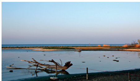
L'île aux oiseaux