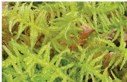
Mousse des jardiniers Pseudoscleropodium purum

Mousses et hépatiques du Pied du Jura , avec la botaniste Joëlle Magnin-Gonze, joelle.magnin-gonze@unil.ch. Max. 20 personnes, inscription obligatoire. Rdv gare de Croy-Romainmôtier, puis covoiturage (merci d'indiquer le nombre de places disponibles). Train de Lausanne 8h27, arr. 8h59. Pique-nique. Retour 16h30.