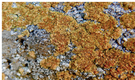
Calogaya pusilla