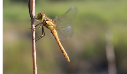
Sympetrum strié

Visite de la réserve naturelle des Grangettes , joyau de la biodiversité, pour l'observation des oiseaux, de la flore et de la faune des étangs avec le gestionnaire Romain Dupraz, romain.dupraz@pronatura.ch. Inscription obligatoire jusqu'au 4 juin. Rdv cabanon d'accueil, à 50 m de l'Eau Froide, à côté du point de collecte des Saviez. Train de Lausanne 8h01, arr. 8h25, ou parking gratuit route des Saviez ; puis 10 min à pied. Retour vers 12h, trains fréquents. Renvoi au 22.06 si mauvais temps.