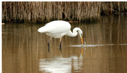
Grande aigrette

Observation des oiseaux du lac de Neuchâtel , avec les ornithologues Jean-Luc Gauchat, jeanlucgauchat@gmail.com , et Jean-Claude Muriset. Rdv gare d'Yverdon. Train de Lausanne 9h34. Nous visiterons l'embouchure du Mujon et l'étang des Tuileries-de-Grandson. Pique-nique. Retour 15-16h à pied ou par bus B630 aux 09, B625 aux 39, trains fréquents.