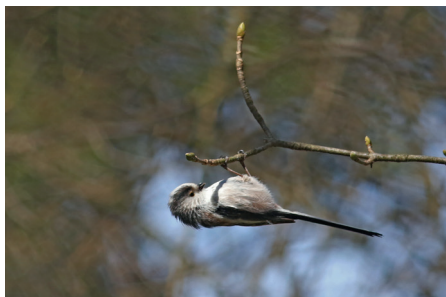
Orite ou mésange à longue queue