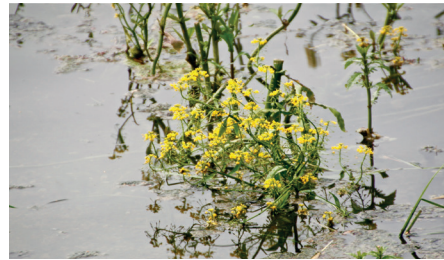
Cresson amphibie

Plantes aquatiques de mare, de rivière et de lac , avec l'ingénieure hydrobiologiste Emilie Tridondane, aldrovande@bluewin.ch. Max. 15 personnes, inscription obligatoire. Rdv parking Rte de Salavaux à l'embouchure de la Broye. Arrêts à la Petite Glâne revitalisée près de St-Aubin et au bord du lac de Neuchâtel près de Gletterens (possibilité de se baigner et de récolter des plantes pour la détermination). Prendre bottes, costume de bain, masque et tuba si souhaité. Pique-nique. Retour 16h30-17h. Renvoi au 20.09 si mauvais temps.