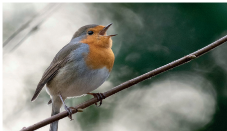
Rouge-gorge familier