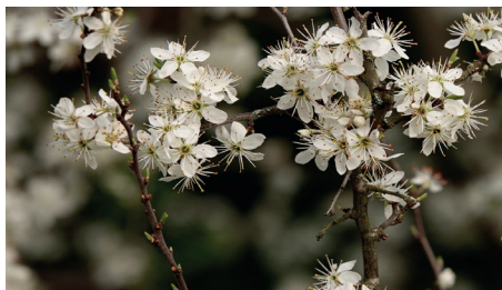
Prunellier ou épine noire